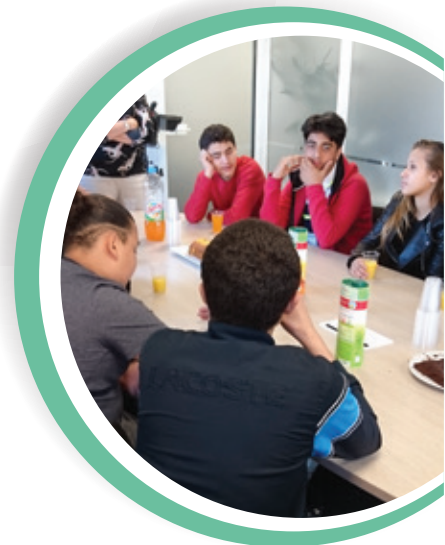
Visite de l'entreprise FORTIL à La Seyne sur mer avec le collège Marie CURIE